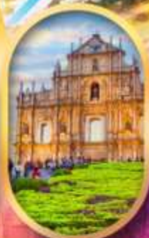
โบสถ์เซนต์พอล