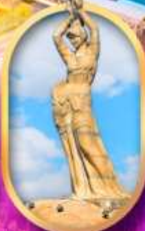
เด็กหญิงชาวประมง