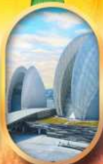
โรงละครไข่มุก