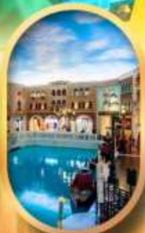
เดอะเวนิเซียน