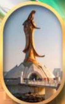
เจ้าแม่ทวนอิมริมทะเล