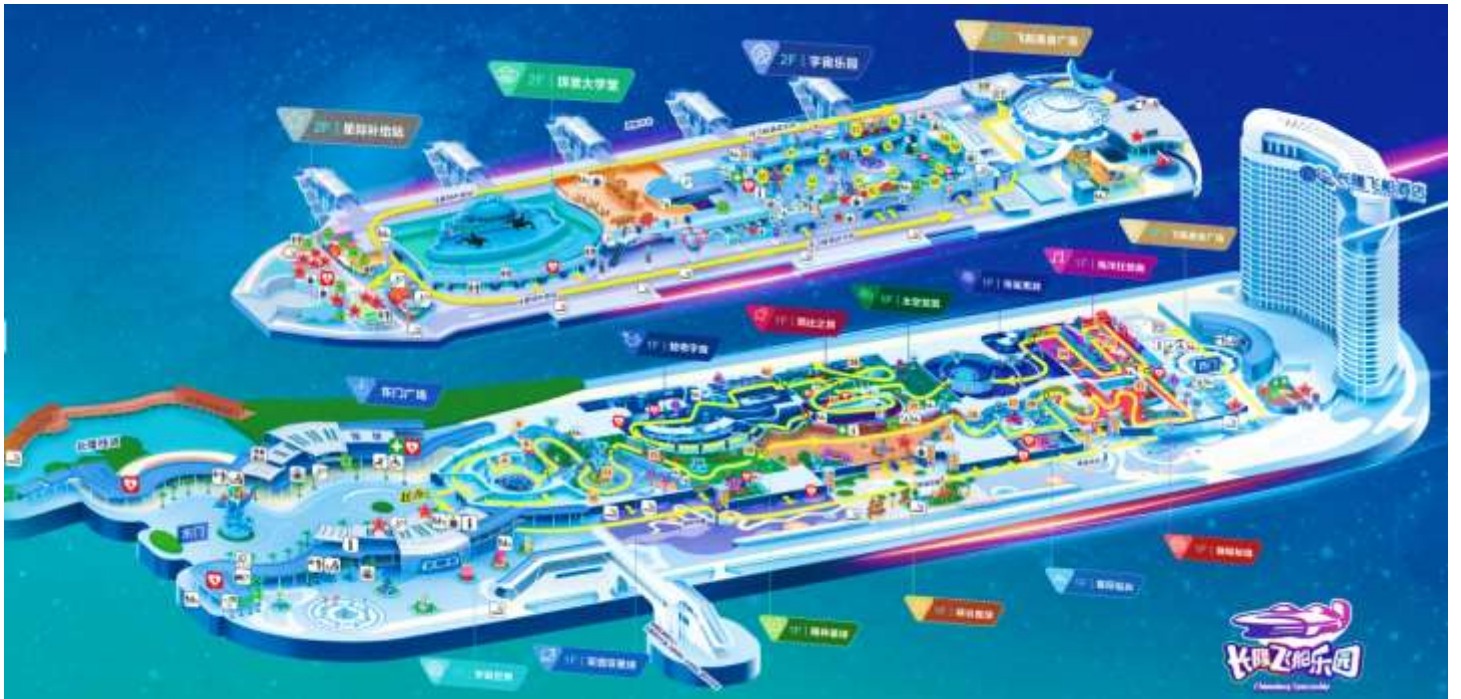
แผนที่ CHIMELONG SPACESHIP PARK