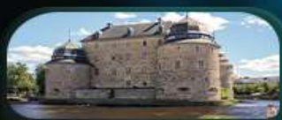
ปราสาทไอโรโบ