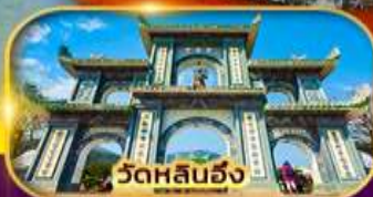
วัดหลันฮั่ง