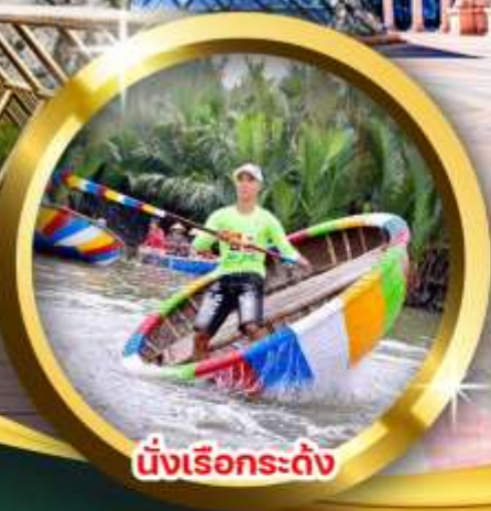
นั่งเรือกระดิ่ง