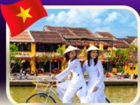
เช่าจักรยานเมืองเก่าฮอยอัน