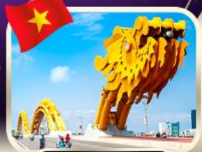
สะพานมังกร ดานัง