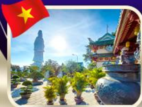
ขอพรกวณอิมวัดหลันอึ้ง