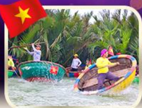
ล่องเรือกระด้งกิมทาน