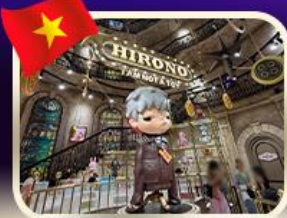
POPMART บานาฮิลล์