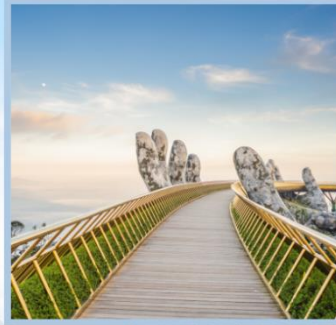
สะพานมือทองคำ