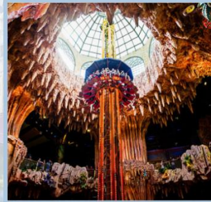
สวนสนุก Fantasy Park