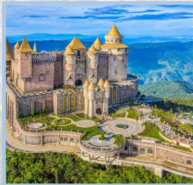
ปราสาทจันตรา