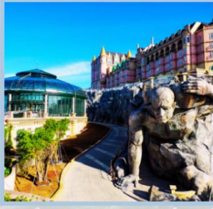
โซน Eclipse Square