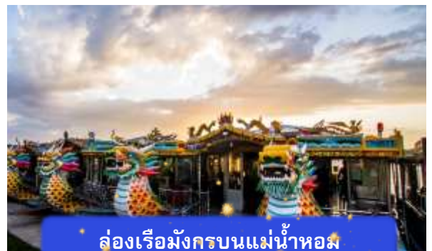
ล่องเรือมังกรบนแม่น้ำหอม

ที่พัก THANH BINH HOTEL ระดับ 4 ดาวมาตรฐานท้องถิ่น หรือเทียบเท่า