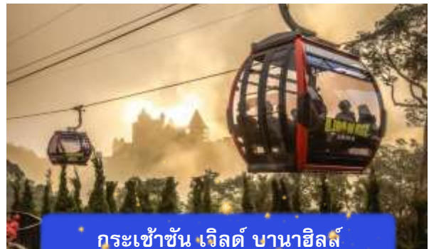
กระเช้าขึ้น เวิลด์ บานาฮิลล์