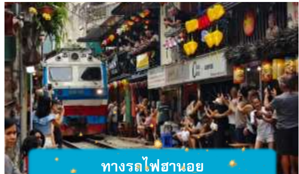
ทางรถไฟฮานอย