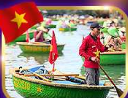
เรือกระด้ง หมู่บ้านก๊อบกาน