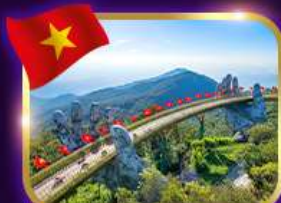
สะพานมือสีทอง บานาฮิลล์