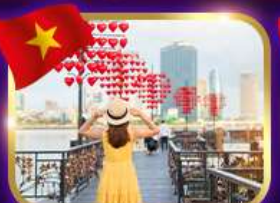
เช็คอินสะพานแห่งความรัก