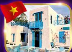
คาเฟ่สุดชิค ซานทรา มาริน่า