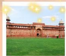
Ajmer Sharif Dargah