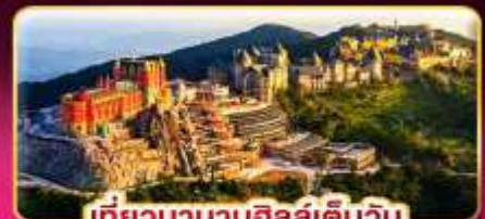
เที่ยวบานาฮิลล์เต็มวัน

ล่องกระทงขามดำคืนที่ฮอยอัน ไฟล์ทสวย บินเช้า-กลับเย็น