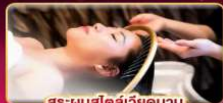
สระผมสไตล์เวียดนาม