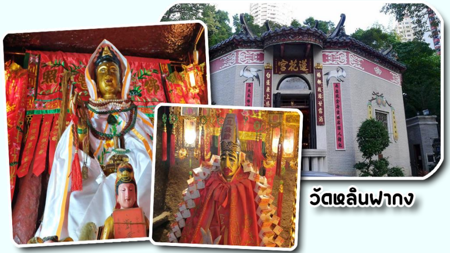
วัดหลินฟาง

นอกจากนี้ทางวัดหลินฟ้าก็ยังมี เทพเจ้าสาวจื่อเอี๊ยะ หรือเทพเจ้าสายนรก เป็นเทพเจ้าที่ขึ้นชื่อเรื่องกตัญญูที่มาในรูปแบบลักษณะการรุ่มง่อม ผ่าดิบ ซึ่งเป็นสัญลักษณ์ของการไว้ทุกข์ที่คนเชื้อสายจีนให้ความสำคัญ เทพเจ้าองค์นี้ก็เปี่ยมไปด้วยพลังหยิน ซึ่งเป็นด้านเกี่ยวกับเงินทองทอง สำหรับผู้ที่ชอบเสี่ยงโชค