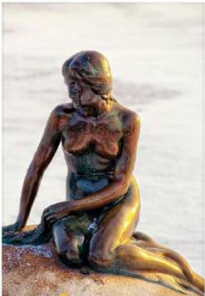
The Little Mermaid

รับประทานอาหารกลางวัน ณ RESTAURANT VITA (15) หรือเทียบเท่า