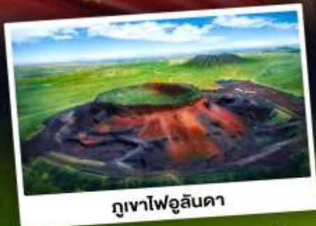
ภูเขาไฟอูลันดา

ท่องเที่ยวแดนแห่งทะเลทรายและทุ่งหญ้า ชมพระอาทิตย์ขึ้นทุ่งหญ้าออร์ดอส