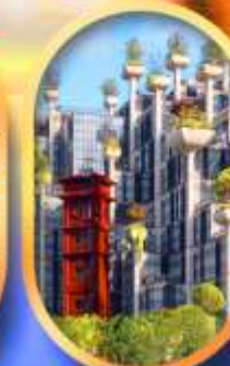
อาคาร 1,000 คับไม้