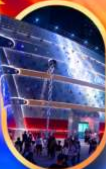
เรือคอะหลุยส์