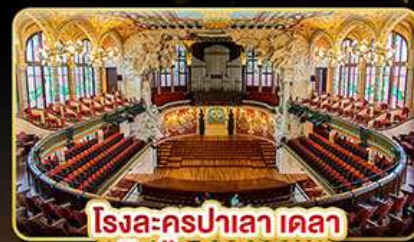
โรงละครปาลาเดลา มูสิคก้า คาคาลานา