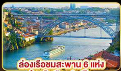
ล่องเรือชมสะพาน 6 แห่ง ในคูโรเมืองปอร์โต