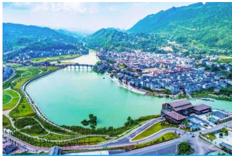
เมืองโบราณจั่วซู่ย

เที่ยง รับประทานอาหารกลางวัน ณ ภัตตาคาร (5)