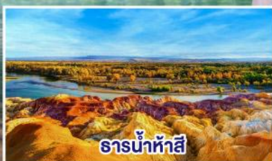
ธารน้ำห้าสี