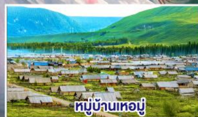
หมู่บ้านห่อมู่