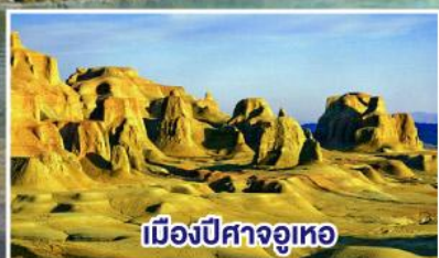
เมืองปีศาจอูเทอ