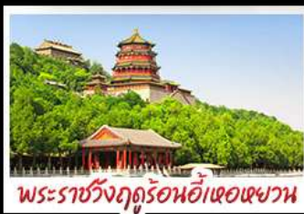
พระราชวังฤดูร้อนอ้าเฮอเฉาหวาน

มือพิเศษ เปิดปีกที่ สุกี่มองโท MICHELIN GUIDE ร้าน TAO TAO JU