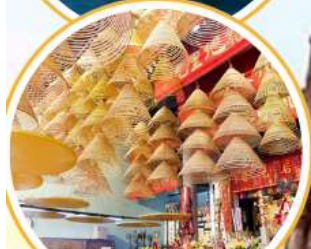
ไหว้พระวัดดัง