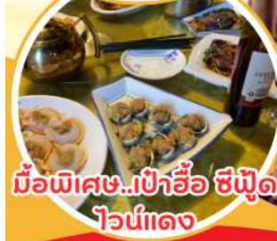
มือพิเศษ...เป่าอ้อ ซิฟูต ไวน์แดง