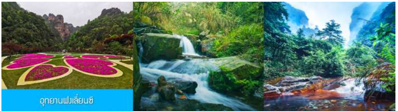
อุทยานฟงเหลียนซี