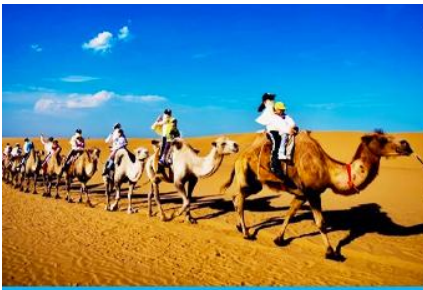
เนินทรายเลี้ยงชวาน