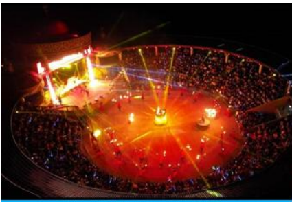
ปาร์ตี้กองไฟยามค่ำ