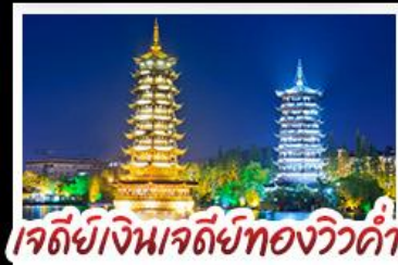
เจดีย์เงินเจดีย์ทองวิวคำ

เมนูพิเศษ บุฟเฟ่ต์ชาบูซีฟู้ด ปลาอบเบียร์ ฝ่อกคริสตัล สุกี้หัด