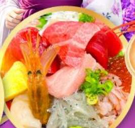
ตลาดปลาชิบิสุ คาชิโนะอิชิ