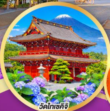
วัดโทเซคิจิ