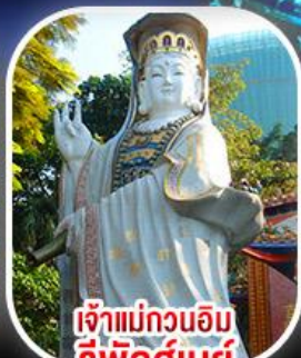
เจ้าแม่กวนอิม รีพัสลีย์