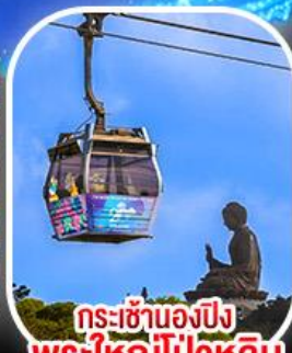
กระเช้าเองปีง พระใหญ่โป่วหลิน