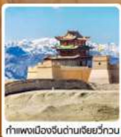
กำแพงเมืองจีนด่านเจี๋ยวี่กวน