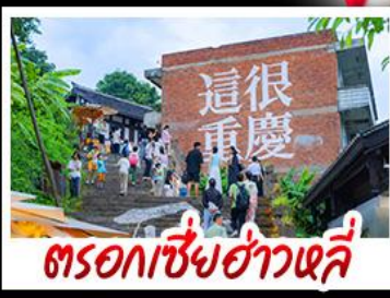
ตรอกซี้ซ่าวหลี่