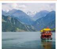
ห้องเรือทะเลสาบเทียนฉือ