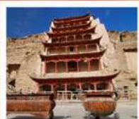
ท่าม่อเกา