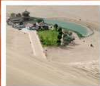
เมืองมิ่งซาซัน