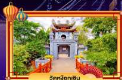
วัดฝอยหิน