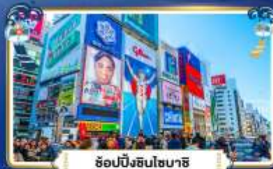
ฮอปบิงชินโซบาสึ