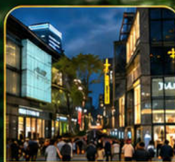
ถนนไท่กู๋หลี่ ศูนย์รวมไลฟ์สไตล์