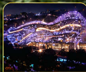
SKP Global Park (ดูไฟ LED)