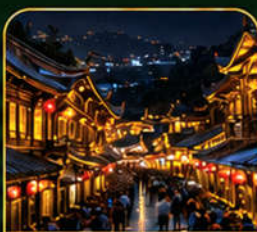
เมืองโบราณ ตูเจียงเหียน