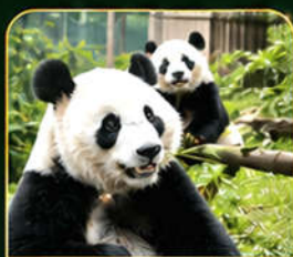
ศูนย์อนุรักษ์แพนด้า แพนด้าเซลฟี่