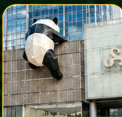
IFS Panda แพนด้าปีนตึก