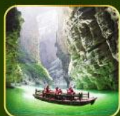
ล่องเรือแม่น้ำไตติงกุฮิว