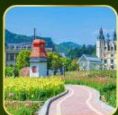
สวน Alice's Garden