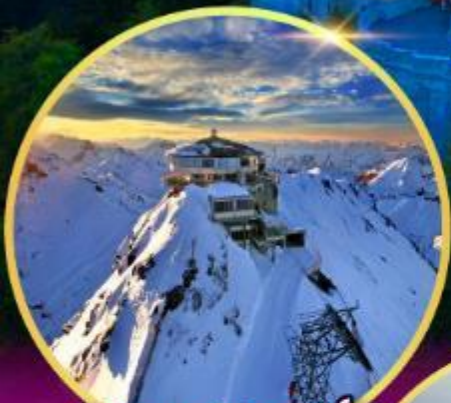
ยอดเขาซิลรอร์น