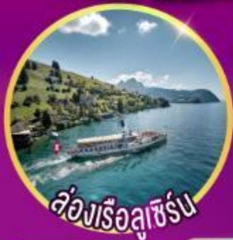
ล่องเรือลูซิิร์น