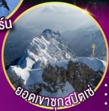
ยอดเขาซุกสปีตเซ