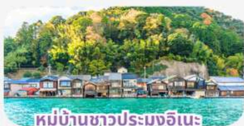
หมู่บ้านชาวประมงอินะ