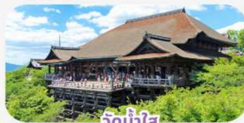
วัดน้ำใส