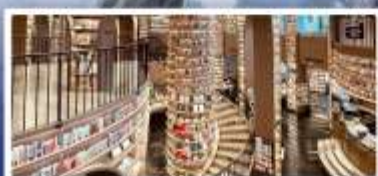
ร้านหนังสือจตุเก๋