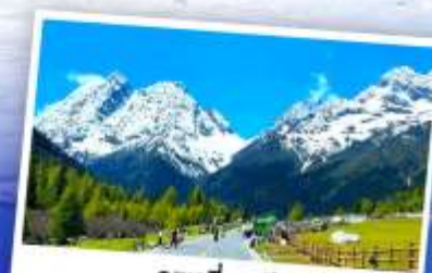
ภูเขาสีครุณี