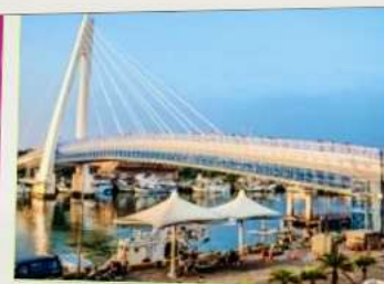
สะพานคู่รักตั้นสุ่ย