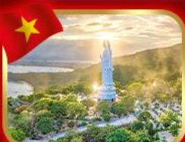
ขอพรกวอนอิม วัดหลั่นอึ้ง