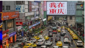
กวนอิมเจียว

*ทางบริษัทฯ ขอสงวนสิทธิ์ในการสลับโปรแกรมทัวร์ตามความเหมาะสมขึ้นอยู่กับสถานการณ์หน้างาน โดยคำนึงถึงผลประโยชน์ของลูกค้าเป็นสำคัญ