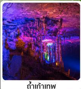
ดำเก้าทพ