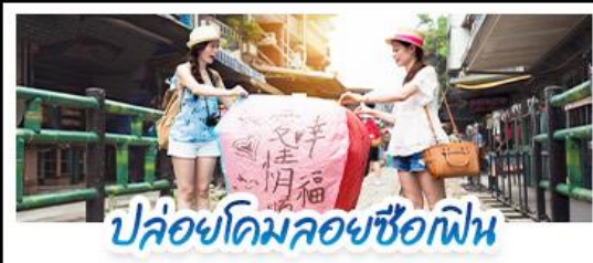
ปล่อยโดมลอยซื้อก๊ฟ