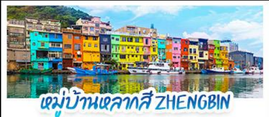
หมู่บ้านหลากสี ZHENGBIN