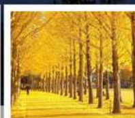
สวนเอ็กซ์โป