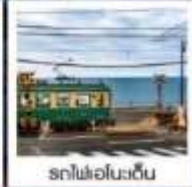
รถไฟเอโนะเด็น