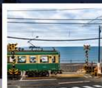
รถไฟโอบะเด็น