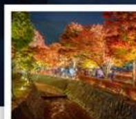
อุโมงค์เมบิซ