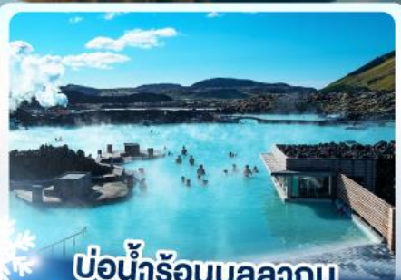
แช่น้ำร้อนบลูลากูน

เก็บไอซ์แลนด์ แดนภูเขาไฟคิรูกูฟลา และ แช่น้ำร้อนบลูลากูน