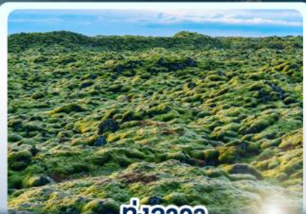
ทุ่งลาวา