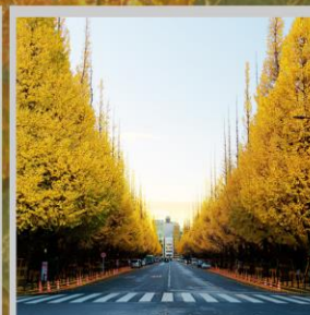
"ICHONAMIKI GINGO AVENUE"