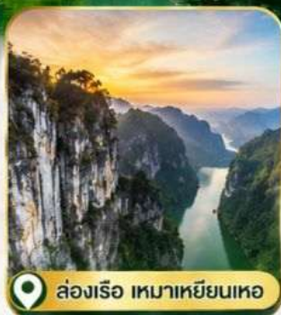
ล่องเรือ เขมาเขี้ยวหนอ