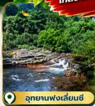
อุทยานฟ่งเลี่ยนซี