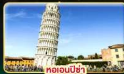
หออนพีซ่า