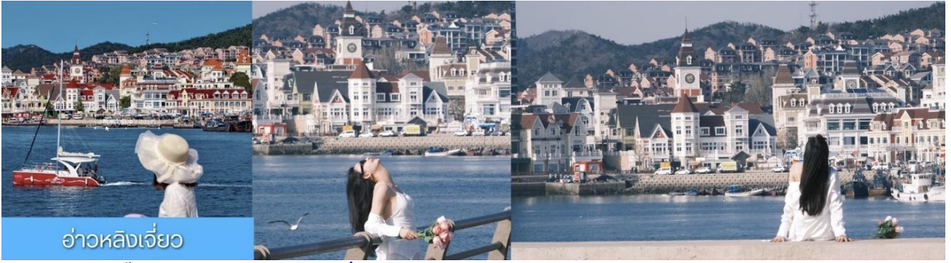
อ่าวหลังเจี้ยว

จากนั้นนำท่านเที่ยวชม อ่าวหลังเจี้ยว 菱角湾 เป็นอ่าวธรรมชาติและแลนด์มาร์กถ่ายรูปสุดฮิตในเมืองต้าเหลียน ประเทศจีน โดดเด่นด้วยทิวทัศน์บ้านเรือนสีแสนสดใสเรียงรายริมน้ำ จนได้รับฉายาว่า "Little Santorini แห่งต้าเหลียน" และเป็นจุดชมพระอาทิตย์ตกที่สวยงามมากแห่ง