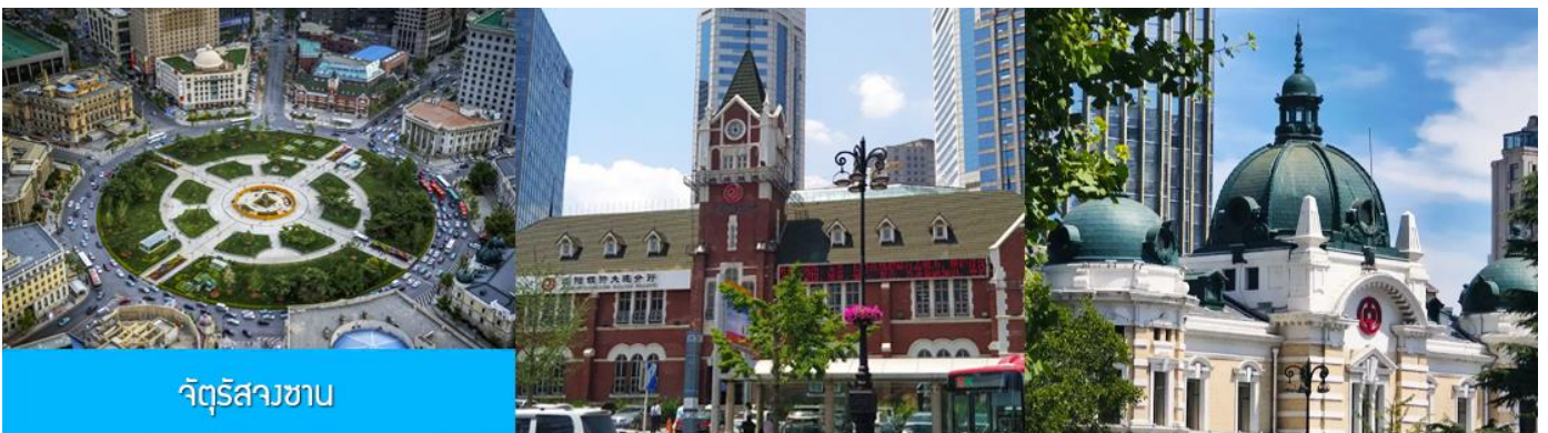
จัตุรัสวงเวียน

จากนั้นนำท่านเที่ยวชม อ่าวหลังเจี้ยว 菱角湾 เป็นอ่าวธรรมชาติและแลนด์มาร์กถ่ายรูปสุดฮิตในเมืองต้าเหลียน ประเทศจีน โดดเด่นด้วยทิวทัศน์บ้านเรือนสีแสนสดใสเรียงรายริมน้ำ จนได้รับฉายาว่า "Little Santorini แห่งต้าเหลียน" และเป็นจุดชมพระอาทิตย์ตกที่สวยงามมากแห่ง