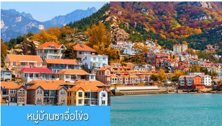
หมู่บ้านชาวจิวไห่