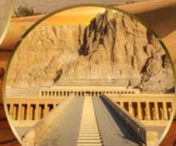
หุบเขากษัตริย์