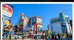
ซ้อปิ้งซีเหมินตง