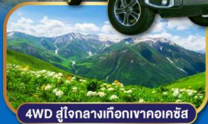
4WD สู่ใจกลางเทือกเขาคอเคซัส