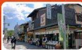
ช้อปปิ้งถนนสายชาเขียว